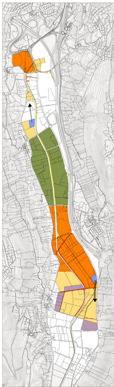
INTERVENTI SUI FONDI ESISTENTI